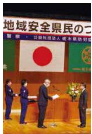
まちづくり推進協議会 様