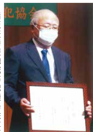
清原交番東地域防犯連絡会 様

清原交番東地域防犯連絡会は、昭和六二年に結成されて以降、通学路や夜間のパトロール、地域住民に対する広報紙の作成配布など、防犯に関する幅広い活動を熱心に取り組んでこられました。 その功績が認められ、「防犯功労団体」が授与されたものです。