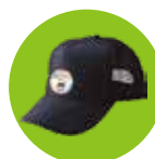
オリジナルキャップ